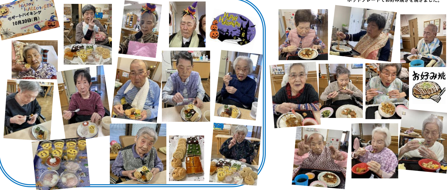
ホットプレートでお好み焼きを焼きました。