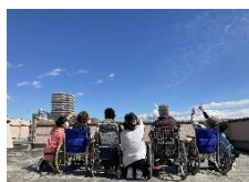
介護実習生さんと過ごしました。

〒452-0817 名古屋市西区二方町15番地 TEL 052-505-2941 FAX 052-505-2981